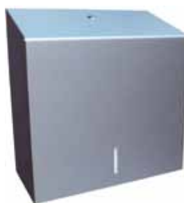
Stalowy pojemnik na ręczniki papierowe STELLA MAXI