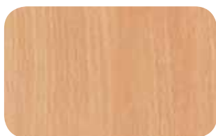
BUK Bawaria - A