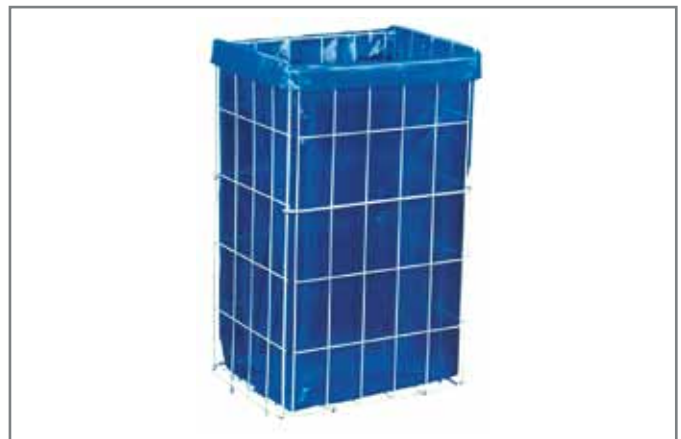
Kosz na zużyte ręczniki papierowe