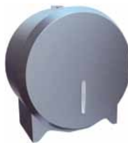
Stalowy pojemnik na papier toaletowy STELLA