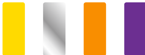
12 - ŻÓŁTY RAL 1021