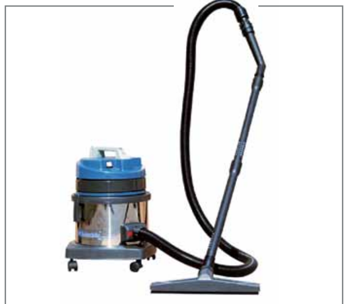
MARIDA odkurzacze profesjonalne

• wykonany z lekkich prętów metalowych powlekanych białym PCV • bardzo wygodny w użytkowaniu • dostosowany do jednorazowych worków • pojemność 47 litrów