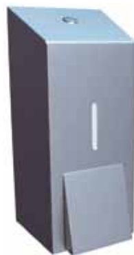
Stalowy dozownik mydła w płynie STELLA