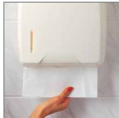
Pojemnik na jednorazowe ręczniki papierowe