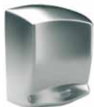
Elektryczna suszarka do rąk OPTIMA