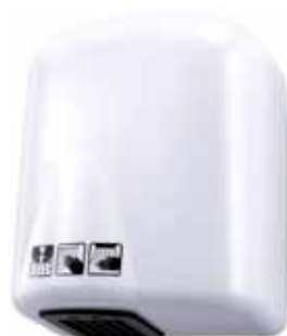
Elektryczna suszarka do rąk ECOFLOW PLUS, biała