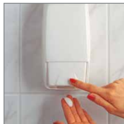
Dozownik na mydło w płynie