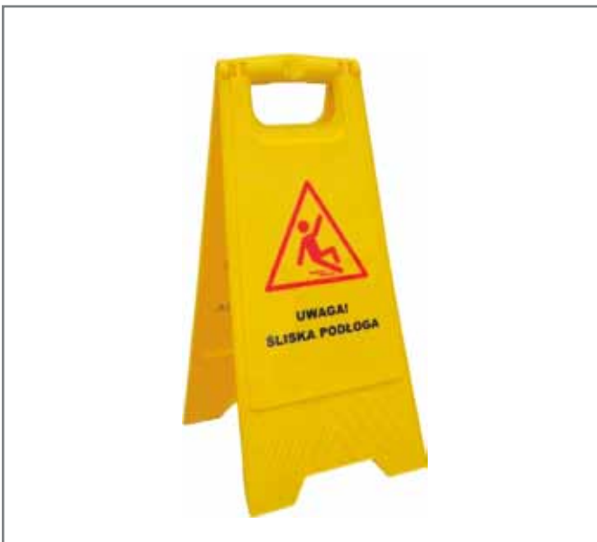
TABLICA OSTRZEGAWCZA „Uwaga śliska podłoga”

• włączana automatycznie • cicha praca • wykonana z tworzywa wysokiej jakości (ABS) • zabezpieczona przed kradzieżą • w kolorze białym lub srebrnym • pobór mocy: 1200W