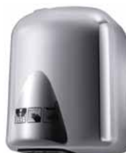
Elektryczna suszarka do rąk ECOFLOW PLUS, szara