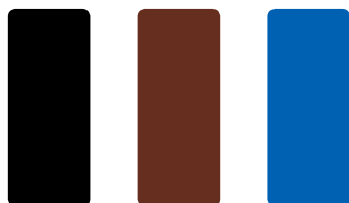
1 - CZARNY RAL 9005