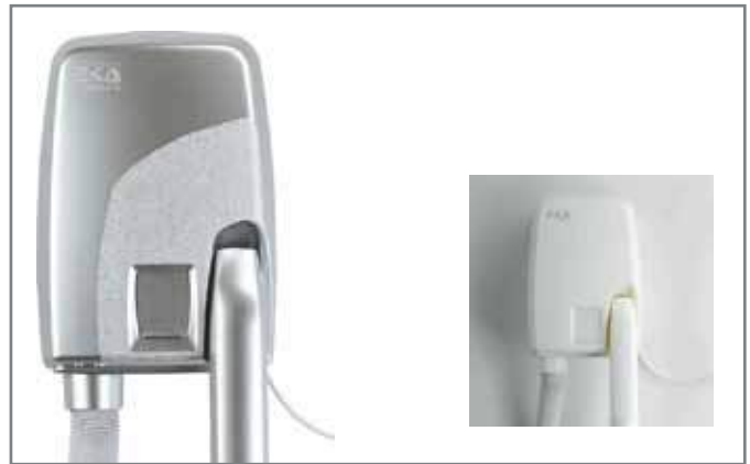
Suszarka uniwersalna do włosów i ciała