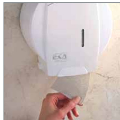
Pojemnik na papier toaletowy JUMBO