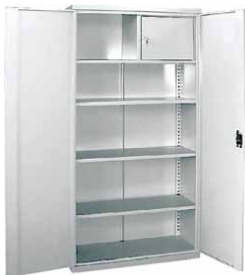
Szafa z trzema regulowanymi półkami